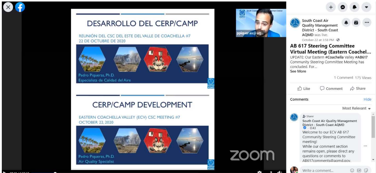
Figura 2-2. – Captura de pantalla de página web comunitaria sobre el Proyecto de Ley AB 617 creada para el ECV